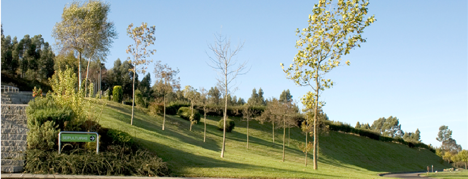
Cementerio de Deva