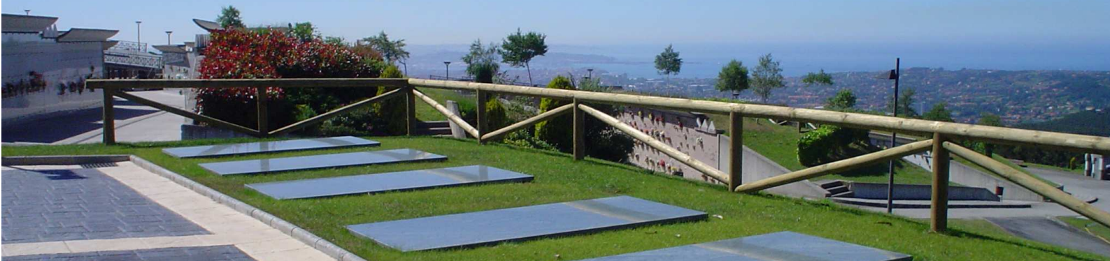
Cementerio de Deva